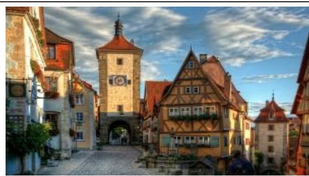
Her fra torvet med vægteren